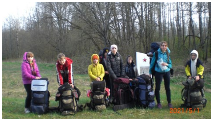
Стела на месте сожжённой деревни Щемилровка

В 1969 году на месте сожжённых, не возродившихся деревень установлены стелы.