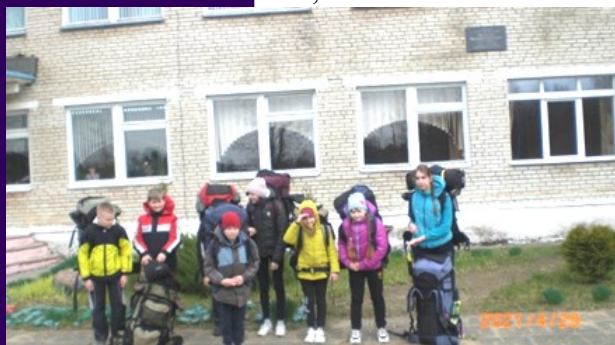
У мемориальной доски В.Г.Щемелёву

У мемориальной доски, размещённой на стене у входа, отдали дань уважения памяти бывшего ученика Малоситнянской школы Валентина Гавриловича Щемелева, который от командира зенитного пулеметного взвода дослужился до генерала.