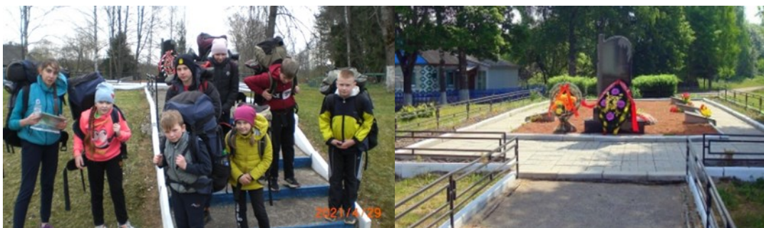
Братская могила советских воинов и партизан, погибших в годы Великой Отечественной войны в Малом Ситно

Минутой молчания почтили память советских воинов и партизан, погибших в годы Великой Отечественной войны. На памятных досках у братской могилы высечены имена более 180 погибших.