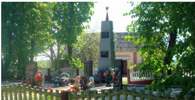
Окончание маршрута в д.Полота

Памятник с непростой историей. Тут несколько раз происхо-